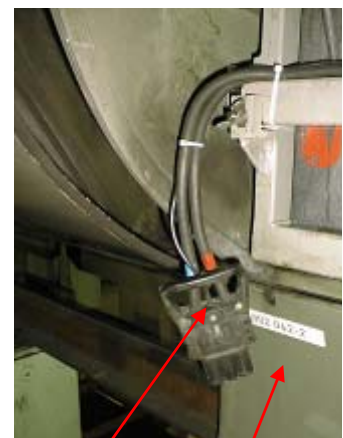
Gezogener Batteriestecker Geöffnete Batteriekastenklappe