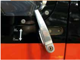
Griff nach oben drehen - Tür schwingt automatisch auf.