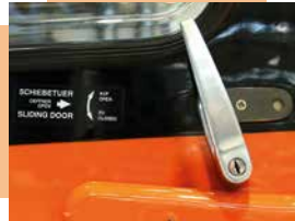
Griff nach oben drehen und Tür nach hinten schieben.