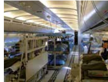
Intensiv-Verlegeluftfahrzeug: zwischen 2 und 162 Personen