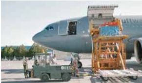
Truppentransporter: zwischen 2 und bis zu 225 Personen

Die Anzahl der Crewmitglieder und Passagiere kann je nach Version variieren: