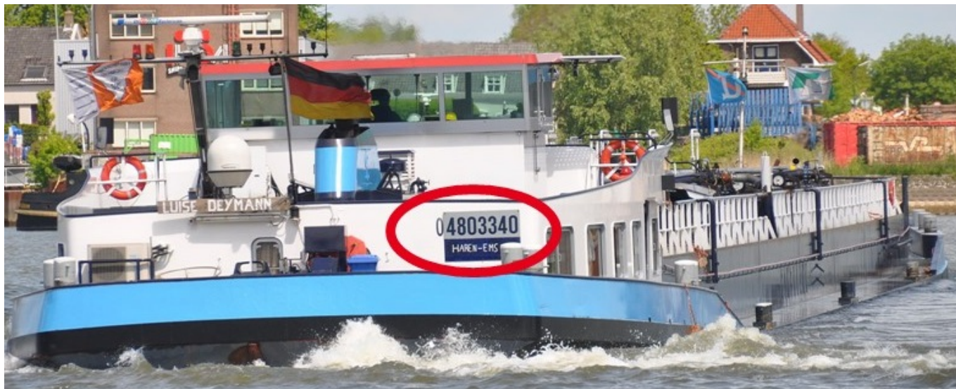
Die achtstellige ENI-Nummer wird als Identifikation verwendet, z.B. hier: