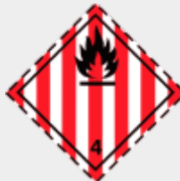
Klasse 4.1: Entzündbare feste Stoffe, selbsterzetzliche Stoffe und desensibilisierte explosive feste Stoffe