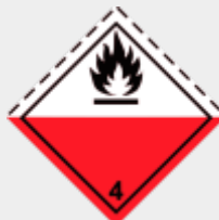
Klasse 4.2 Selbstentzündliche Stoffe