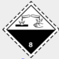
Klasse 8: Ätzende Stoffe