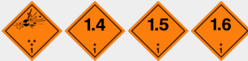
Klasse 1: Explosionsgefährliche Stoffe

Folgende Placards (Großzettel) können nach den ADR-Vorschriften angebracht sein (zu detaillierteren Vorgehenshinweisen zu den einzelnen Klassen siehe CBRN-Einsätze / ABC-Einsätze / GSG-Einsätze ):