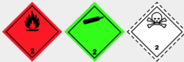
Klasse 2: gasförmige Stoffe