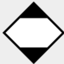
gefährliche Güter in begrenzten Mengen