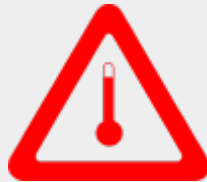
Stoffe, die in erwärmtem Zustand befördert werden