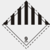
Klasse 9: Verschiedene gefährliche Stoffe und Gegenstände