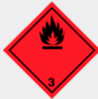
Klasse 3: Entzündbare flüssige Stoffe