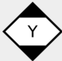
gefährliche Güter in begrenzten Mengen - Luftfracht