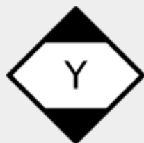
gefährliche Güter in begrenzten Mengen - Luftfracht