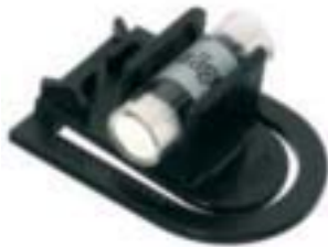
Direktanzeigendes Diffusionsröhrchen im Halter